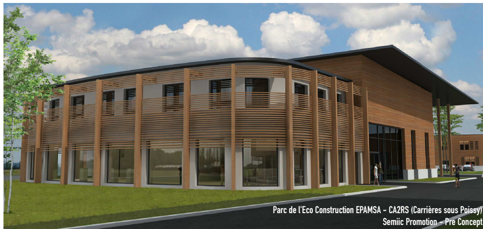
Parc de l'Eco Construction EPAMSA - CA2RS (Carrières sous Poissy) Semiic Promotion - Pre Concept

S.M. : Pourquoi une entreprise devrait-elle faire le choix de Seine Aval selon vous ?