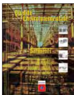
Référence n° 3182